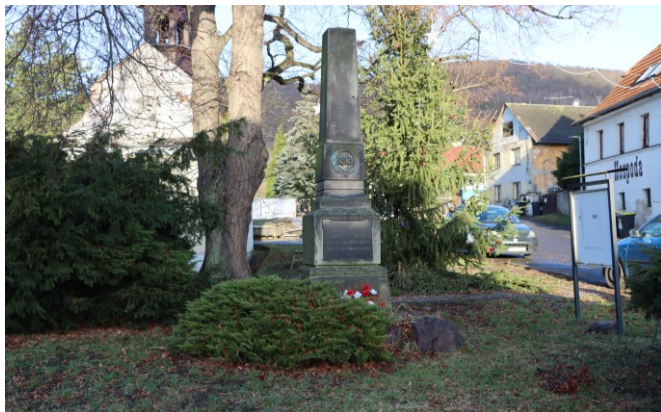
Das Denkmal im Dorf Straden.

Man läuft auf dem gelb markierten Weg durch das Wäldchen zum Wegweiser im Dorfczentrum von Přeřtanov zurück. Dort läuft man geradeaus in Richtung Chlumec weiter. Der gelbe Wanderweg verläuft ab dem Dorfcende auf einem schmalen Betonplattenpfad und über eine kleine Brücke nach Stradov (Straden). Dort läuft man zweimal links und kommt zum Gasthaus U Dořtrařilů und zum Denkmal am Stradener Dorfplatz (2h45). Es ist knapp vier Meter hoch und vergleichsweise schlicht. Es wurde einhundert Jahre nach der Schlacht in Erinnerung an die blutigen Kämpfe um das Dorf errichtet.