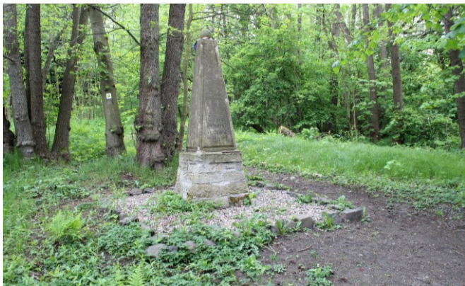
Das Denkmal am Ort von Vandammes Gefangennahme.

ausgerichteter Wegweiser. Unmittelbar nach dem Wasserhäuschen am Waldrand rechts zweigt links am Bach ein Pfad ab. Auf diesem gelang man ansteigend und die Eisenbahnstrecke unterquerend zum Vandamme-Denkmal Pomník gen. Vandamma (340 m), dem Ort der Gefangennahme des französischen Befehlshabers (4h00).