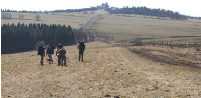
Auf dem Weg zurück zum Mückentürmchen.

Eine bittere Ironie der Geschichte ist es oft, dass nicht derjenige die Lorbeeren für Heldentaten erntet, der sie mit Geschick geplant und vollbracht hat, sondern jener, der die Taten erstmals vermeldet und dabei mächtige Verbündete im Rücken weiß. So ist es auch bei der Schlacht um Kulm gewesen. Der Ruhm der Abwehr der Franzosen am ersten Kampftag wurde bereits kurz nach der Schlacht Graf Ostermann-Tolstoi zugeschrieben, obwohl es Prinz Eugen von Württemberg war, der den tagelangen Rückzug von Pirna und die Kämpfe des 29. August 1813 anführte. Stets ist die Rede vom hohen Blutzoll der Russischen Garden vor Priestern unter dem Kommando von Ostermann, selten vom Rückzugskampfe des 2. russische Korps unter Württemberg, dessen Anteil an der Rettung der Böhmisches Armee nicht hoch genug bewertet werden kann.