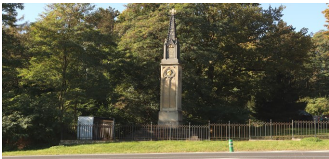
Das Preußische Denkmal.

Hinter dem Denkmal beginnt ein Pfad, der den Dorfbach des ehemaligen Weilers Sernitz überquert und erneut zu den Gleisen führt. Jenseits läuft man nicht zurück nach Žandov, sondern links im Wald hinunter zum versteckten Oprám-Teich, wo man sich den Weg mit wilden Mountainbikern teilt. Über dem See ist eine originelle Seilbrücke installiert, Badesachen mitbringen! Schließlich kommt man zu einem großen Parkplatz, wo eine Imbiss-Hütte zu Speis und Trank einlädt. Dahinter steht das Preußische Denkmal (4h00).