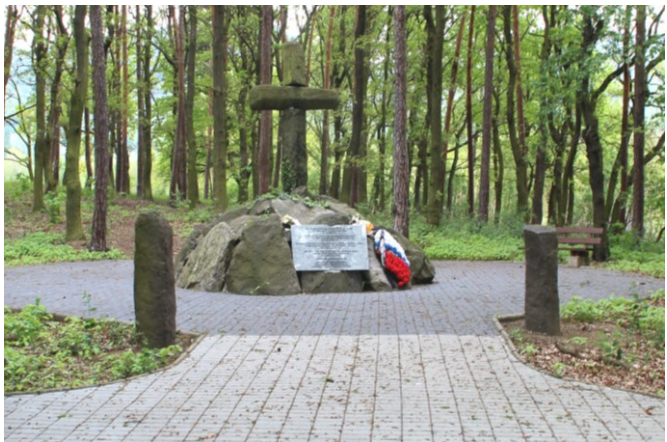
Das Massengrab in der Mitte des Wäldchens.

Im Zentrum des friedlichen Waldes befindet sich das Massengrab (Hromadný hrob, 220 m, 2h00). Dort erhebt sich unter hohen Laubbäumen ein auf Felsbrocken stehendes Steinkreuz inmitten einer gepflasterten Fläche. Davor ehrt eine Tafel die 10.000 hier begrabenen Toten der Schlacht, die 1835 an diesen Andachtsort umgebettet worden sind.