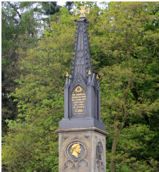
Die kunstvolle Spitze des Preußischen Denkmals.

Es ist das älteste von allen und wurde bereits 4 Jahre nach der Schlacht aufgestellt. Die gusseiserne Spitze hat der berühmte Baumeister Karl Friedrich Schinkel geschaffen. Erst nach vierzig Jahren hat man sie auf die hohe steinerne Säule mit der Büste des Preußenkönigs Friedrich Wilhelm III. gesetzt – damit war man mit dem monumentalen Österreichischen Denkmal gegenüber wieder auf Augenhöhe.