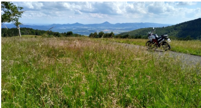
Im oberen Teil der Alten Poststraße mit Blick auf den Milleschauer.

Der Tag beginnt mit einem kleinen Spaziergang auf der Fortführung des Kammweges östlich vom Mückentürmchen. Auf dem breiten blau und rot markierten Weg steigt man über weite Wiesen zum Goldammer-Kreuz ab und wandert dann leicht bergan zum Wegweiser Fojtovická pláň (720 m, 0h20). Dort kreuzt die Alte Teplitzer Poststraße, die bis ins 19. Jahrhunderts hinein die einzige einigermaßen sichere Gebirgsüberquerung für Fuhrwerke ermöglichte und Dresden mit Prag verband. Der steile Abstieg vom Gebirge ist heute blau markiert und verläuft anfangs auf asphaltierten Grund und mit beeindruckender Aussicht auf die spitzen Kegel des Böhmisches Mittelgebirges. Bei Eintritt in den Wald wandelt sich die ehemalige Poststraße zu einem mühsam dem steilen Hang abgetrotzten Fahrweg, der früher mit Gespannen und Karren ausgesprochen schwierig zu befahren war. Man erzählt sich, dass Reisende für diese Passage sicherheitshalber aus ihren Kutschen aussteigen mussten und mit Sänften hinuntergetragen wurden! Am Wegweiser Kyšperk (458 m), dem Abzweig zur uralten Geiersburg-Ruine, quert man den Bergrücken (1h00).