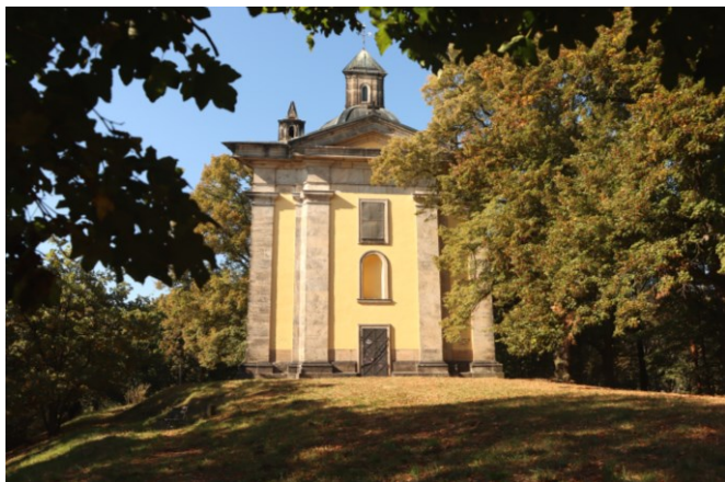
Die Kapelle auf dem Horkaberg.

Man läuft vom Denkmal die wenigen Meter zu den gelben Markierungen zurück und folgt ihnen links nach Osten. Auf einem Radweg erreicht man Chlumec (Kulm). An der großen Bushaltestelle biegt man links ab und läuft am Stadtpark entlang zur St.-Gallus-Kirche, deren Ursprünge auf das Jahr 1130 zurückgehen. Hinter der Kirche hält man sich rechts. Am Waldrand beginnt als bequeme Spazierpromenade der Kreuzweg hinauf zum Hügel Horka (Horkaberg, 287 m), auf dem die Kapelle der Heiligen Dreifaltigkeit steht (3h15). Sie ist 1691 aus Anlass der Verschonung der Familie Kolowrat bei einem Pestausbruch errichtet worden.