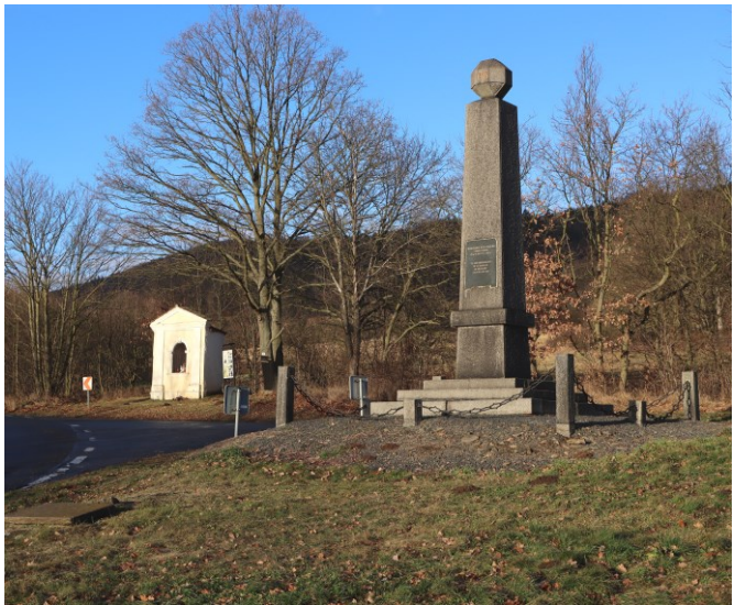
Das Denkmal für die Schlacht von Kulm und die Juchtenkapelle.

Über den leicht absteigenden Waldweg erreicht man die Straße bei der Juchtenkapelle Juchtová kaple (251 m), die in etwa in der Mitte des harten Abwehrkampfes, der hier in der zweiten Tageshälfte des 29. August 1813 geführt wurde, steht (1h45). Auf der gegenüberliegenden Straßenseite befindet sich das erste Denkmal des Tages. Den schmalen Obelisken mit einer eckigen Kugel auf der Spitze haben die Bewohner des nahen Priester aus Spenden in Vorbereitung zur Hundertjahr-Feier der Schlacht 1912 aufgestellt. Das Mahnmal wird fälschlicherweise oft als „Französisches Denkmal“ bezeichnet, vermutlich weil es das einzige ist, das Inschriften auch in französischer Sprache trägt. Richtigerweise ist es ein Denkmal für alle Opfer der Schlacht.