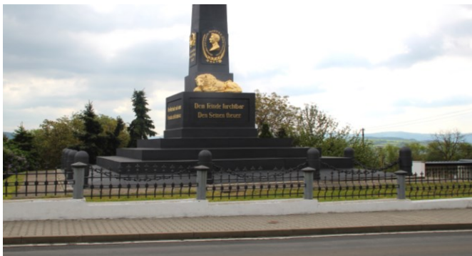
Das Österreichische Denkmal.

Dieses steht auf der anderen Straßenseite und stammt von 1825. Mit seinen riesigen Kettengliedern, der goldenen Büste von General Feldzeugmeister Colloredo-Mansfeld und dem zweiflügligen Adler ist es nicht zu übersehen. Mit dem monumentalen Bau wird der Abwehr von Napoleons Versuchs, zwei Wochen nach der Schlacht von Kulm in Böhmen einzudringen, gedacht.