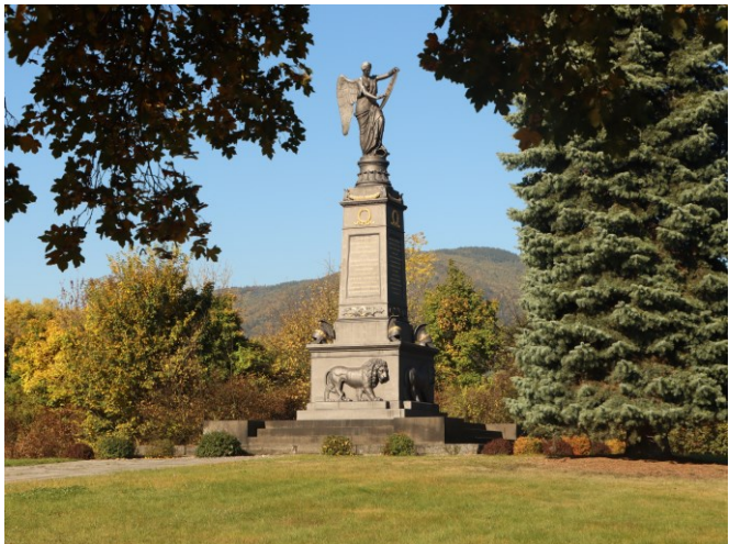
Das Russische Denkmal.

Der Legende nach befand sich hier das Hauptkommando, als die Vorgehensweise für den zweiten Kampftag besprochen wurde. Im Zentrum einer großen, von einer hohen Hecke umgrenzten Fläche steht die geflügelte Statue der Siegesgöttin Nike auf einem gusseisernen Sockel. Das Monument ist 1835 aufgestellt worden. Auch das Wachhaus mit einer vergilbten Schlachtbeschreibung stammt aus dieser Zeit.